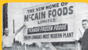
Harrison e Wallace no local da fábrica de Florenceville, 1956.

Isso porque a McCain se preocupa com a qualidade dos produtos, o bem-estar dos consumidores e a rentabilidade dos restaurantes, garantindo a melhor experiência possível para todos os envolvidos, desde a escolha dos insumos e matérias-primas até o consumo nas mesas pelos nossos clientes.