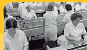
O corte nos primeiros dias era trabalhoso.